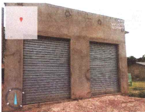
FOTO 01 - FACHADA FRONTAL