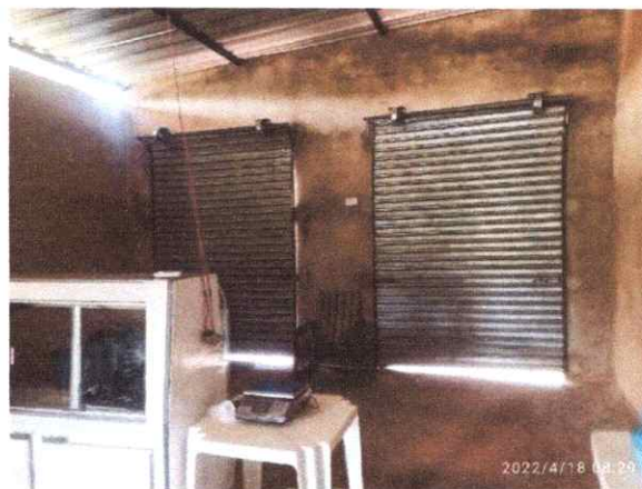
FOTO 02 - INTERIOR DO IMÓVEL