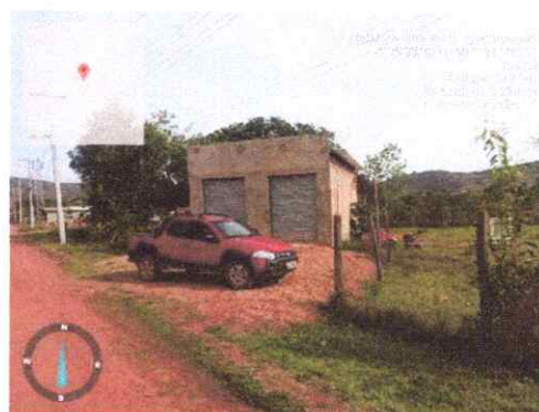
FOTO 02 - FACHADA LATERAL