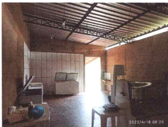
FOTO 03 - INTERIOR DO IMÓVEL